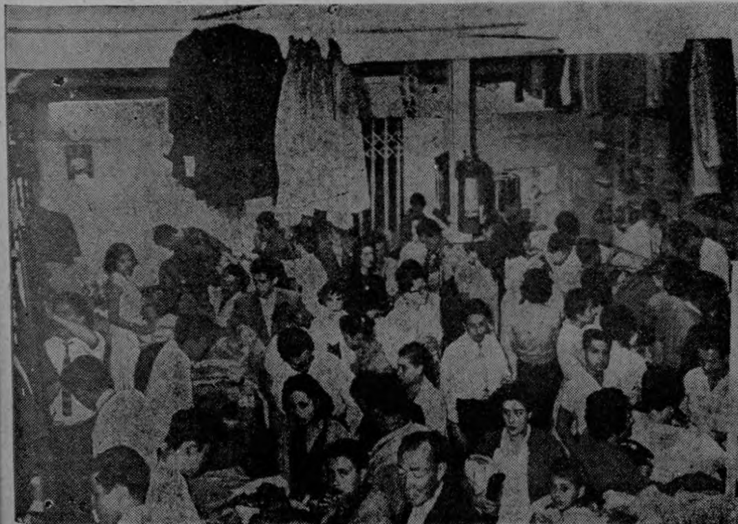
Un aspecto parcial del interior de los establecimientos Alán & Alán que se vieron obligados a cerrar sus puertas ante la enorme cantidad de público concentrado en los salones de despacho, durante los pasados días de Navidad. Al fondo puede apreciarse las enormes puertas de hierro cortando el acceso al exterior, porque ya era prácticamente imposible dar cabida a una persona más

El comercio de San José tendió los apuros más grandes del año en la semana pasada y en los días anteriores al 24, cuando ya es tradicional que el Niño otorgue los regalos que un familiar, pariente o amigo se haya permitido adquirir para cumplimentar el obsequio oportuno.